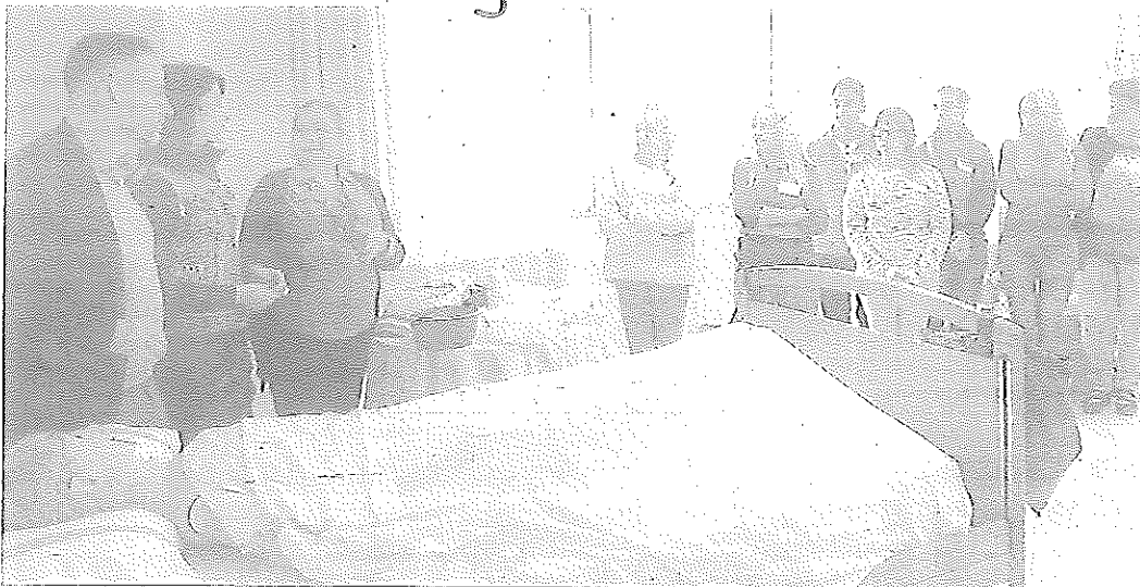
Alumnos en el taller de empleo que se lleva a cabo en la Residencia Asistida de Diputación.

Si realiza una transacción con un terminal móvil o tablet, es recomendable, según indica la Dirección General que haga dicha transacción por medio de una aplicación móvil, si existe, en lugar de utilizar la página de Internet.