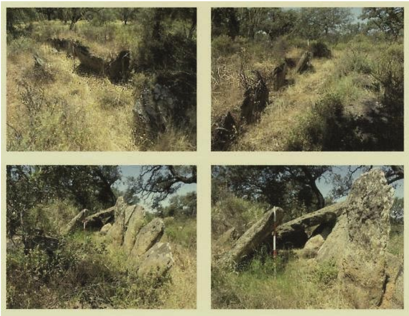
Vista del conjunto dolménico de Los Gabrieles

Tipo de Intervención: Intervención Arqueológica de Urgencia.