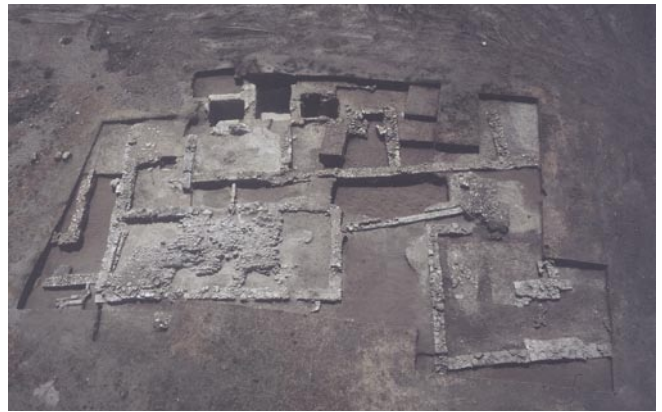
Actividad arqueológica realizada en Arraijanal. Bahía de Málaga.