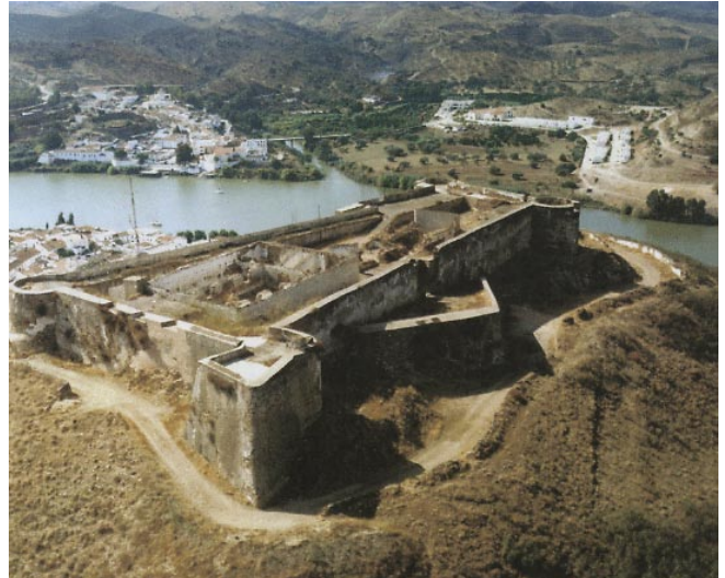
Perspectiva del Castillo de San Marcos, Sanlúcar de Guadiana (Huelva).

Aproximadamente el 80 % de las intervenciones arqueológicas realizadas en la Zona Arqueológica de Huelva durante el año 2003 se han localizado en el Sector A-1 Casco Antiguo . Se trata del espacio del casco urbano actual que todavía preserva buena parte de los testimonios materiales de su historia soterrados bajo la rasante actual, siendo la zona de mayor desarrollo urbano a lo largo de la Historia y la que mejor caracteriza el proceso de superposición de ciudades, concepto fundamental a la hora de entender la evolución de un yacimiento donde cada intervención arqueológica se entiende como una unidad de análisis independiente, pero englobada en un mismo yacimiento. En este sentido, las intervenciones arqueológicas en suelo urbano aportan