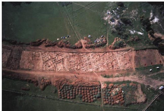
Vista aérea zona central Tramo II. Urbanismo musulmán