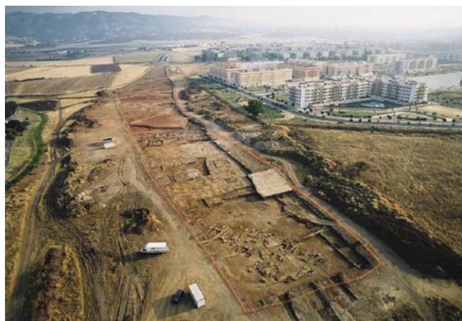
Final Tramo II. En primer término necrópolis romana.