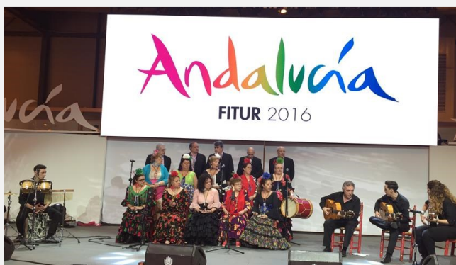
Coro rociero de la Casa de Andalucía en Móstoles

El consejero de Turismo y Deporte, ha mantenido un encuentro con los responsables de la Federación de Casas de Andalucía del Centro de España.