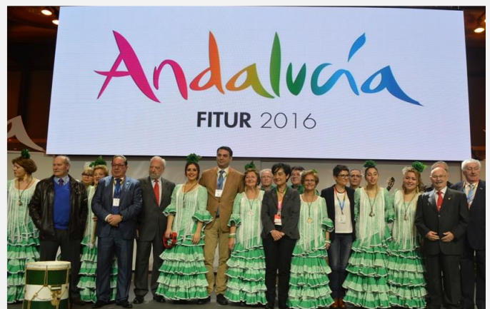
Coro rociero de la Casa de Andalucía en Parla, consejero de Turismo y Deporte, delegada de la Junta de Andalucía en Madrid y miembros de la junta directiva de la FECACE

Además del concurso y de diversas degustaciones gastronómicas programadas, el expositor de la región en la feria contó con las actuaciones de grupos de Casas Regionales de Andalucía, en concreto con el Coro rociero "Amanecer" y con el grupo de baile "Embrujo" de la Casa de Parla. También con las actuaciones del Coro rociero "Los Jarales" y grupos de baile "Sangre del Sur" y "Salinas Blancas" de la Casa de Móstoles.