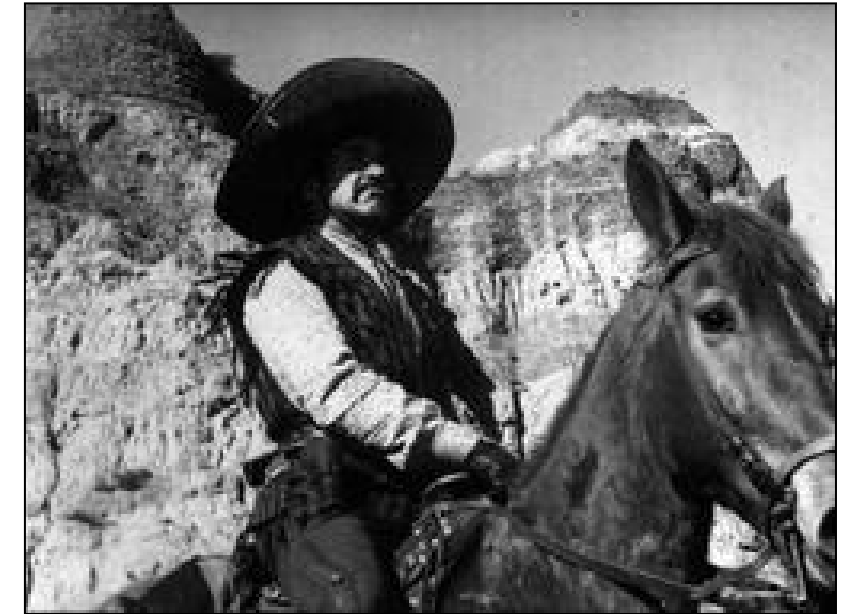
7 pistolas para los Macgregor, dirigida en 1966 por Franco Giraldi

"Todo este fondo de valle parece ser una gran masa de lógamo; el pozo o sedimento de un gran lago que por muchos siglos ha conservado sus aguas, habiendo recibido las tierras y arenas arrastradas por los torrentes de los montes vecinos." ANDREO DAMPIERRE, SALVADOR (1839-1843). Relatos de Granada. Recuerdos de Andalucía. Edición facsímil. Editorial Albaida. Granada, 1992