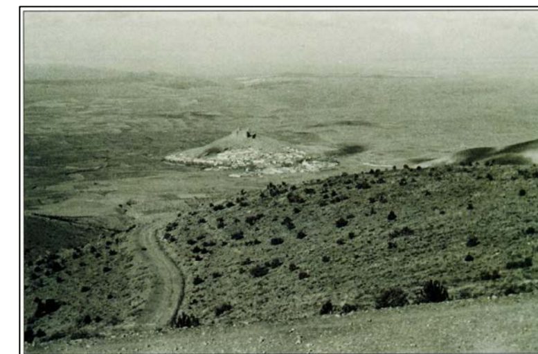
A. Castillo, Monte La Calahorra, en el borde NE. del Parque Natural de Sierra Nevada, al fondo el casco urbano y su castillo, 1958.