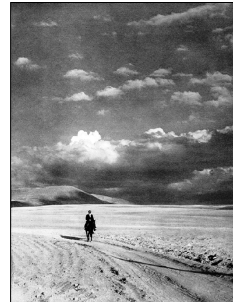
Jean Sermet, [Desolación en la llanura del Marquesado], 1950