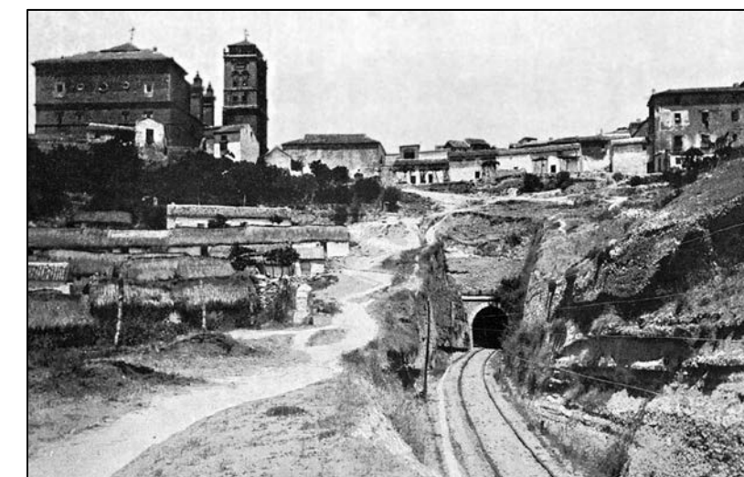
Anónimo, [Iznalloz], hacia 1900