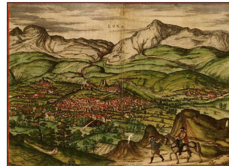
Joris Hoefnagel, Loxa, 1576.

"La Vega está colocada en medio de montañas que ocultan entre sus faldas hermosas huertas. El río Genil es aquí profundo y ancho como el Tajo en Aranjuez. Sus alamedas con frondosísimas. De las sierras de los contornos se desprenden manantiales riquísimos, que hacen que toda la vega sea abundante en aguas." JEREZ PERCHET, AUGUSTO. Impresiones de viaje. Andalucía. El Rif. Madrid: Librería de Bailly-Bailliere, 1873