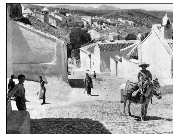
Anónimo, [Loja], 1955

"En el curso del Genil se encuentran los vistosos paisajes conocidos por los Infiernos de Loja, sitios amenos de gran profundidad, en los que el agua corre como filtrándose por medio de los tajos que hay en su fondo, con un ruido bronco e imponente..." JIMÉNEZ, ANTONIO. Los infiernos de Loja. Madrid: Blanco y Negro, pp. 41, 1911