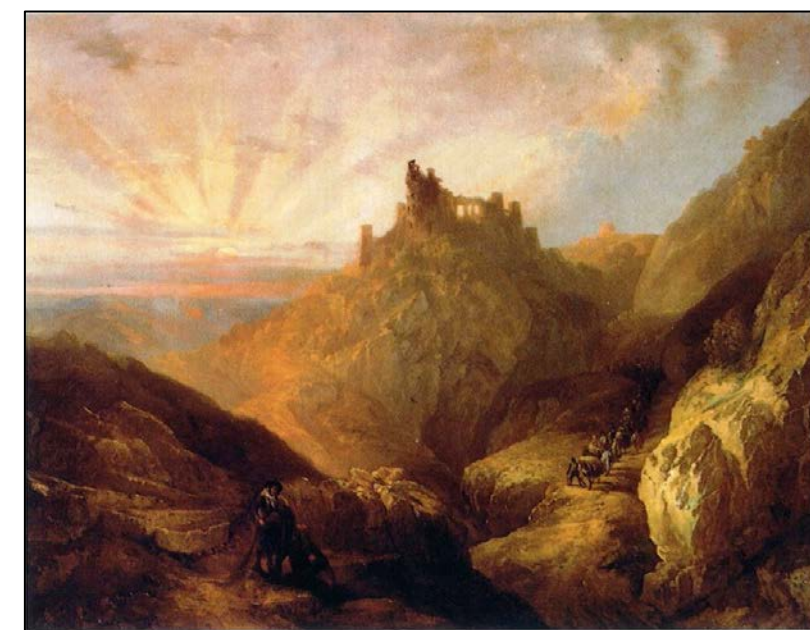
Genaro Pérez Villaamil, Gargantas de las Alpujarras, 1848

"El cultivo de los campos es posible gracias sobre todo al riego artificial. El cultivo comienza con los sembrados de patatas y centeno, a más de 2000 metros de altitud, de los que las primeras alcanzan su madurez a los once meses, y acaba con la batata y la caña de azúcar del sur. La producción de fruta y frutos secos aumenta de norte a sur e incluye desde las cerezas, moras, castañas y nueces, que se cultivan a 1.600 metros de altitud, hasta una gran variedad de frutos subtropicales que se cultivan junto a la costa. Existe un gran contraste entre las lomas, por un lado, secas y castigadas por el sol, y las verdes tierras de cultivo y los fértiles valles por otro." Rein, JOHANESS JUSTUS: Aportación al estudio de Sierra Nevada (1899), pp. 194. Granada: Caja General de Ahorros de Granada, 1994.