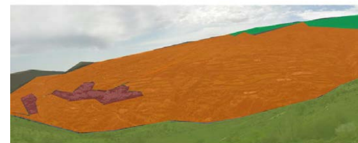
Sierra litorales Núcleos rurales Cultivos y vegetación natural Cultivos en terrazas Repoblaciones

Los valles angostos longitudinales canalizan los cursos de alta montaña hacia el valle del Guadalfeo, que discurre en sentido oeste-este recorriendo el surco alpujarreño.