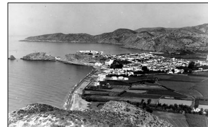
Anónimo, [Almuñécar], 1910.

MADOZ, PASCUAL. Diccionario geográfico estadístico histórico de la provincia de Granada (1845-1850)