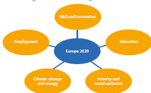
Figura 1: Áreas de la Estrategia EU 2020

Asimismo, las prioridades de la Estrategia y sus objetivos se estructuran en cinco áreas: empleo, investigación y desarrollo (I + D), cambio climático y energía, educación y reducción de la pobreza.