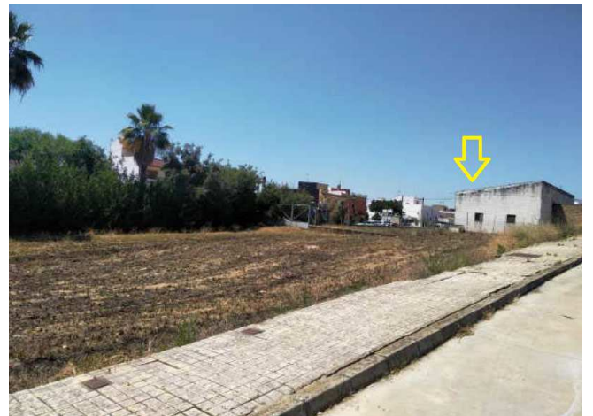
Vista de la parcela desde calle Alhambra