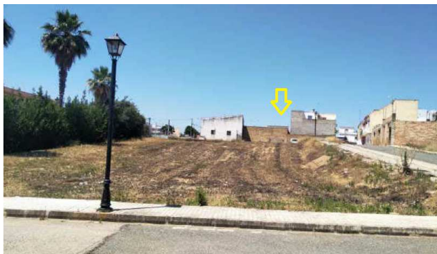
Vista desde calle Vistula