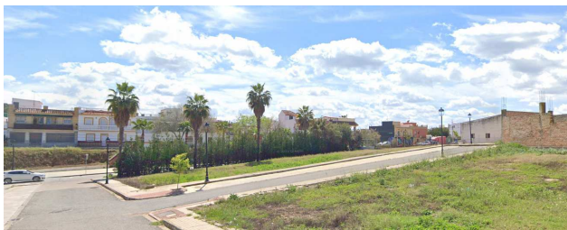
Vista de calle Alhambra y del entorno