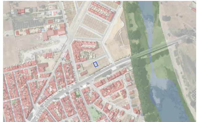
Ubicación de la parcela en el sector

Vista aérea con ubicación de la parcela catastral