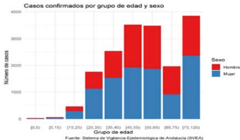
Figura 1. Pirámide por grupo de edad y sexo de los casos confirmados de COVID-19 en Andalucía.

Tanto niños y niñas como personas adultas pueden infectarse y desarrollar la enfermedad. En Andalucía, de acuerdo al Informe de la Consejería de Salud y Familias sobre la Evolución de la Pandemia del COVID-19 en la Comunidad Autónoma de Andalucía a fecha 16 de junio (BOJA 19 Junio) de los 17.650 casos confirmados hasta el 16 Junio, sólo un 0,5 % se corresponde a población entre 0 y 15 años.