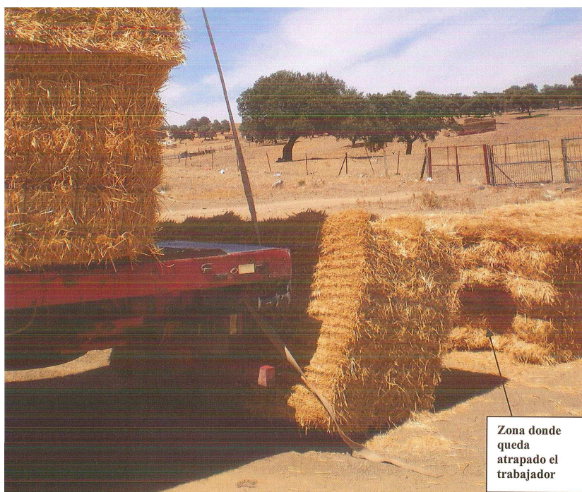
Imagen 3. El segundo fardo que cayó desde una altura de casi 3 m le impactó sobre el tórax.

Este sistema, utilizado el día del accidente, aunque más peligroso, es más rápido ya que tiene que desplazar menos veces el camión durante la descarga, subir y bajar de la cabina, y calzar y descalzar las ruedas traseras.