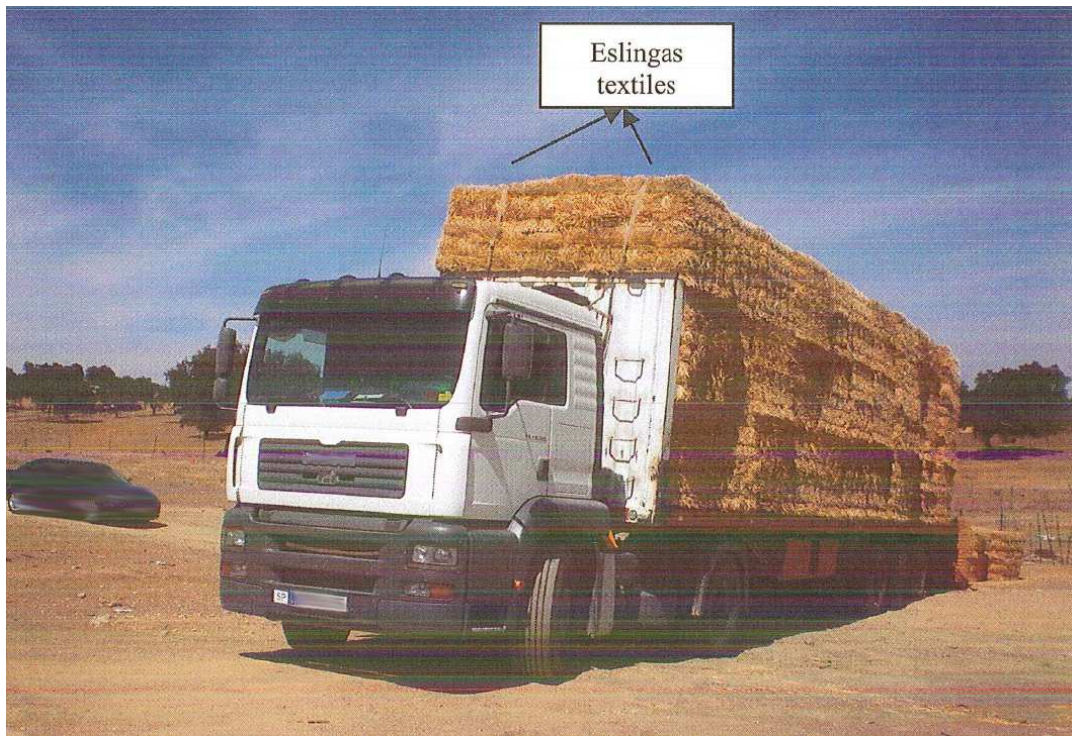
Imagen 1. Parte anterior del remolque donde enganchan las dos eslingas textiles que sujetaban la carga

El conductor colocó el camión de forma paralela a la línea de máxima pendiente de la ladera, con la cabeza tractora, situada en la zona más alta, y la zona de descarga del remolque en la más baja. Esta era la forma habitual de operar en esas condiciones, para descargar a favor de pendiente y facilitar el trabajo del motor de accionamiento del transportador de cadenas.