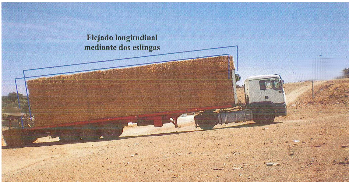
Imagen 2. Posición de estacionamiento del conjunto camión y remolque

El conductor colocó el camión de forma paralela a la línea de máxima pendiente de la ladera, con la cabeza tractora, situada en la zona más alta, y la zona de descarga del remolque en la más baja. Esta era la forma habitual de operar en esas condiciones, para descargar a favor de pendiente y facilitar el trabajo del motor de accionamiento del transportador de cadenas.