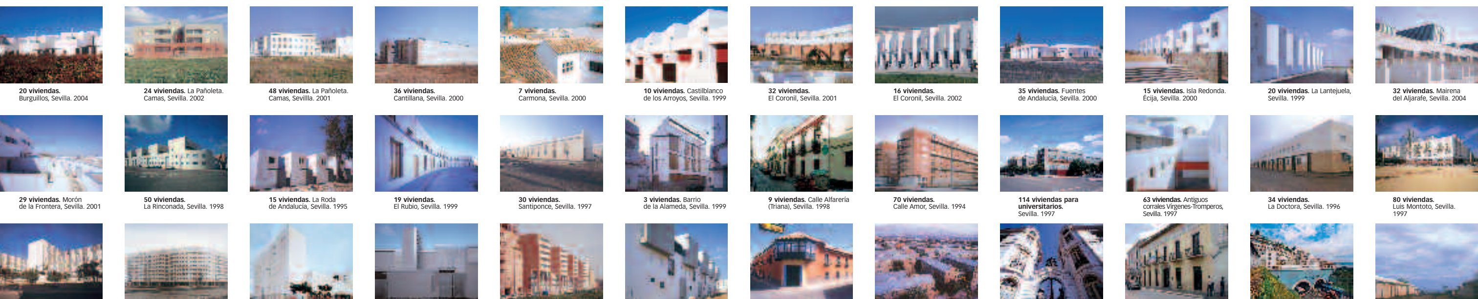
20 viviendas. Burguillos, Sevilla. 2004 24 viviendas. La Pañoleta. Camas, Sevilla. 2002 48 viviendas. La Pañoleta. Camas, Sevilla. 2001 36 viviendas. Cantillana, Sevilla. 2000 7 viviendas. Carmona, Sevilla. 2000 10 viviendas. Castilblanco de los Arroyos, Sevilla. 1999 32 viviendas. El Coronil, Sevilla. 2001 16 viviendas. El Coronil, Sevilla. 2002 35 viviendas. Fuentes de Andalucía, Sevilla. 2000 15 viviendas. Isla Redonda. Écija, Sevilla. 2000 20 viviendas. La Lantejuela, Sevilla. 1999 32 viviendas. Mairena del Aljarafe, Sevilla. 2004 29 viviendas. Morón de la Frontera, Sevilla. 2001 50 viviendas. La Rinconada, Sevilla. 1998 15 viviendas. La Roda de Andalucía, Sevilla. 1995 19 viviendas. El Rubio, Sevilla. 1999 30 viviendas. Santiponce, Sevilla. 1997 3 viviendas. Barrio de la Alameda, Sevilla. 1999 9 viviendas. Calle Alfarería (Triana), Sevilla. 1998 70 viviendas. Calle Amor, Sevilla. 1994 114 viviendas para universitarios. Sevilla. 1997 63 viviendas. Antiguos corrales Virgenes-Tromperos, Sevilla. 1997 34 viviendas. La Doctora, Sevilla. 1996 80 viviendas. Luis Montoto, Sevilla. 1997 174 viviendas. Palmete, Sevilla. 2001 117 viviendas. Polígono Aeropuerto, Sevilla. 1994 158 viviendas. Polígono Aeropuerto, Sevilla. 1999 99 viviendas. San Jerónimo, Sevilla. 1997 68 viviendas. Ronda del Tamarguillo, Sevilla. 1999 30 viviendas. Tomares, Sevilla. 2000 Rehabilitación Pabellón Oficiales Reales. Potosí, Bolivia. 2004 178 viviendas. Comunidad Andalucía, Santiago. 1992 Cité Recreo/Cité Las Palmas. Santiago de Chile. 2003 Rehabilitación Casa Ponce. Quito, Ecuador. 2002 Rehabilitación Balcón de San Roque. Quito, Ecuador. 2004 Las Flores de Andalucía. El Cuco, El Salvador. 2001