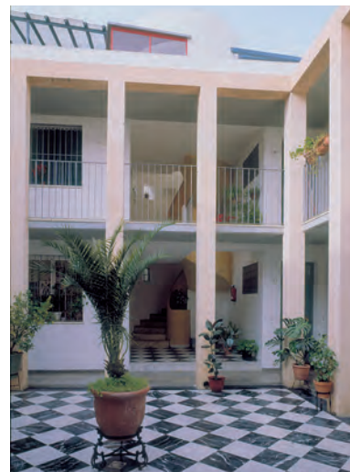
Ermita del Socorro 27 viviendas de PPV