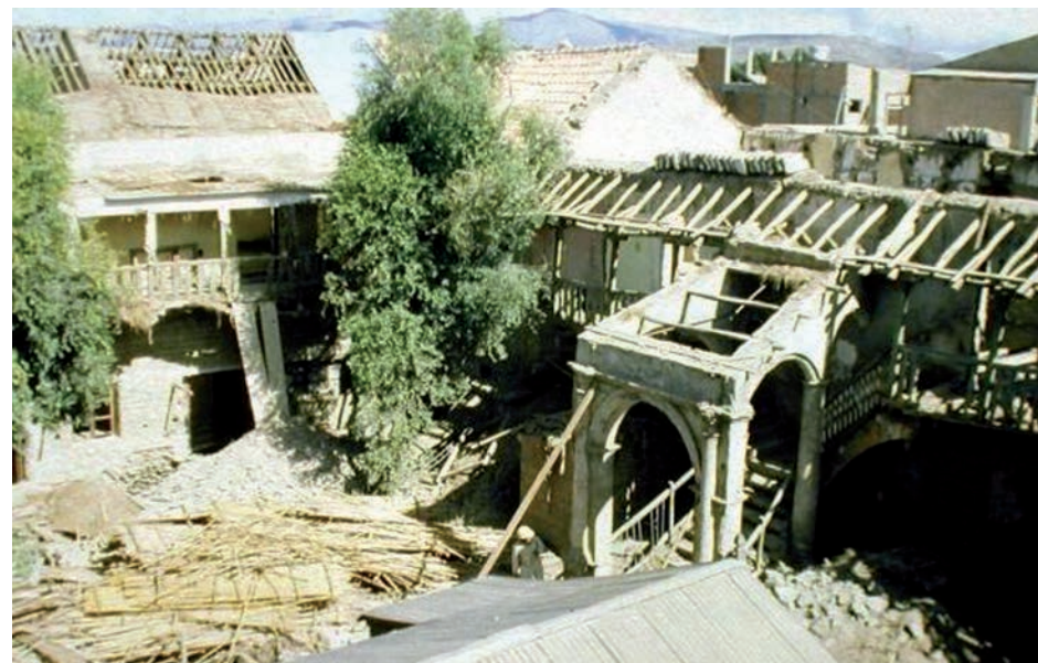
Estado inicial del patio del edificio.

En general, se ha limpiado el edificio de intervenciones ajenas para reconocer su estructura tipológica original, rehaciéndose los muros afectados con ladrillos de adobe y complementando la viguería original con otra nueva de madera. El patio ha reconstruido su escala, reubicándose la fuente de 1924 y conservándose los dos árboles existentes, poco comunes en este medio urbano. Su pavimento también recupera el material original a base de cantos rodados.