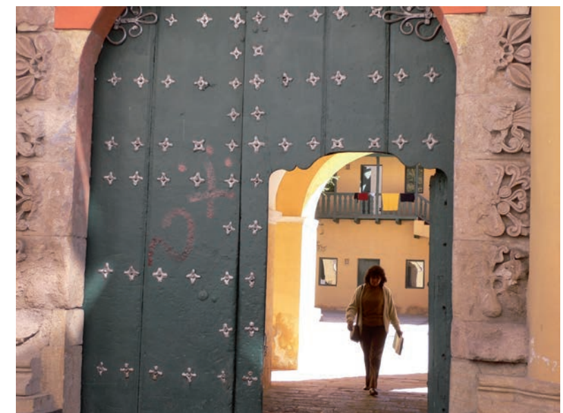
Vistas interiores y exterior del edificio recuperado.