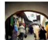
3. Calle M'kadem