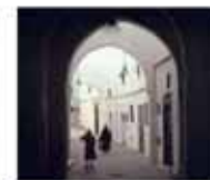
2. Adarve Zauia Tijania