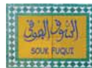
Ejemplos de la señalización de calles y monumentos