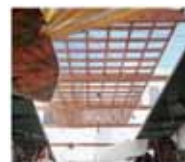
4. Gran Plaza