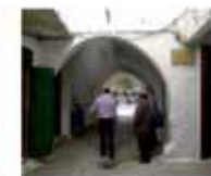
7. Señalización de calles