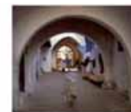
6. Plaza del Pan