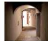
2. Adarve Tnana