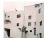
5. Plaza del Pan