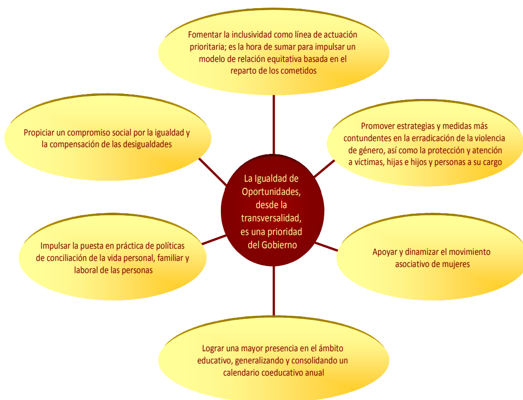
Gráfico 1. Prioridad transversal del Gobierno Canario

La Igualdad de Género es una prioridad transversal del Gobierno Canario manifiesta entre las líneas básicas de actuación de la legislatura 2011-2015.