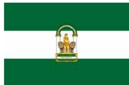
Bandera institucional de Andalucía.

La bandera de Andalucía es la formada por tres franjas horizontales – verde, blanca y verde – de igual anchura.