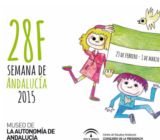
Cartel del Museo de la Autonomía de Andalucía. Coria del Río (Sevilla).