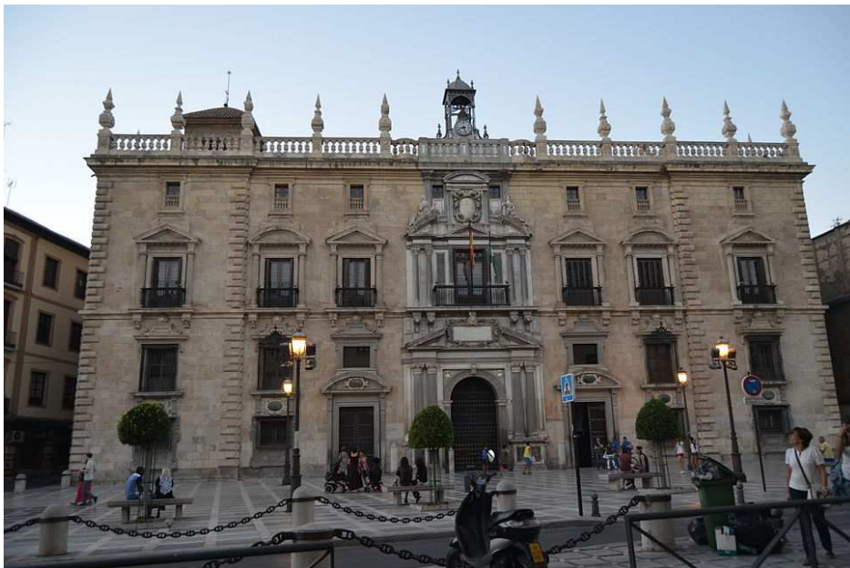
Sede del Tribunal Superior de Justicia de Andalucía, Ceuta y Melilla en Granada.

El Tribunal Superior de Justicia de Andalucía es el órgano jurisdiccional en que culmina la organización judicial en Andalucía.