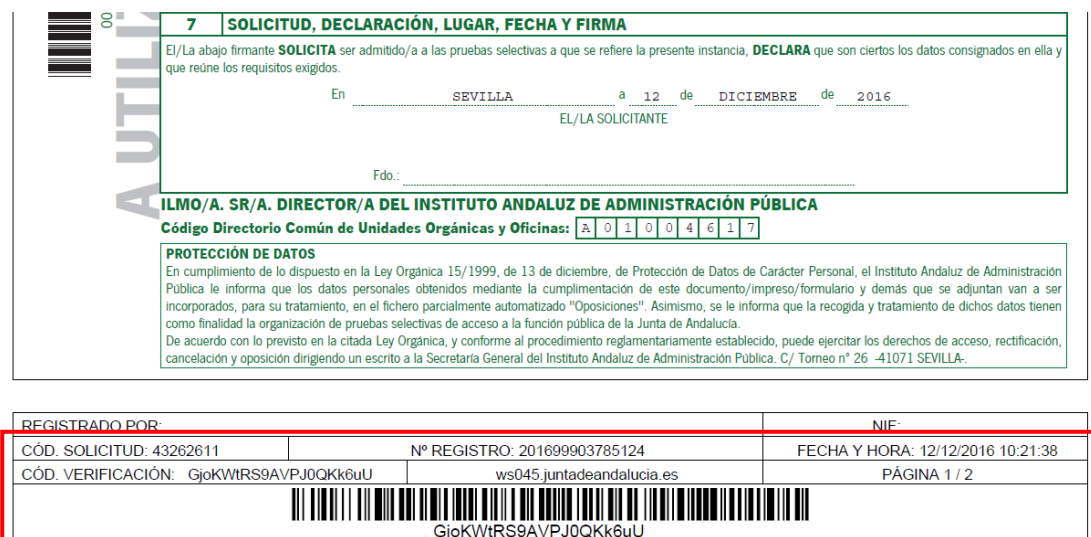
Figura 6.- Datos relativos a la presentación telemática

NOTA IMPORTANTE: Si usted no dispone código de solicitud, nº de registro, la fecha y la hora de la presentación telemática, su solicitud no ha sido presentada ante el Registro Telemático Único de la Junta de Andalucía, encontrándose en estado Borrador.