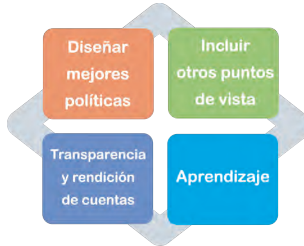
BENEFICIOS DE LA EeA