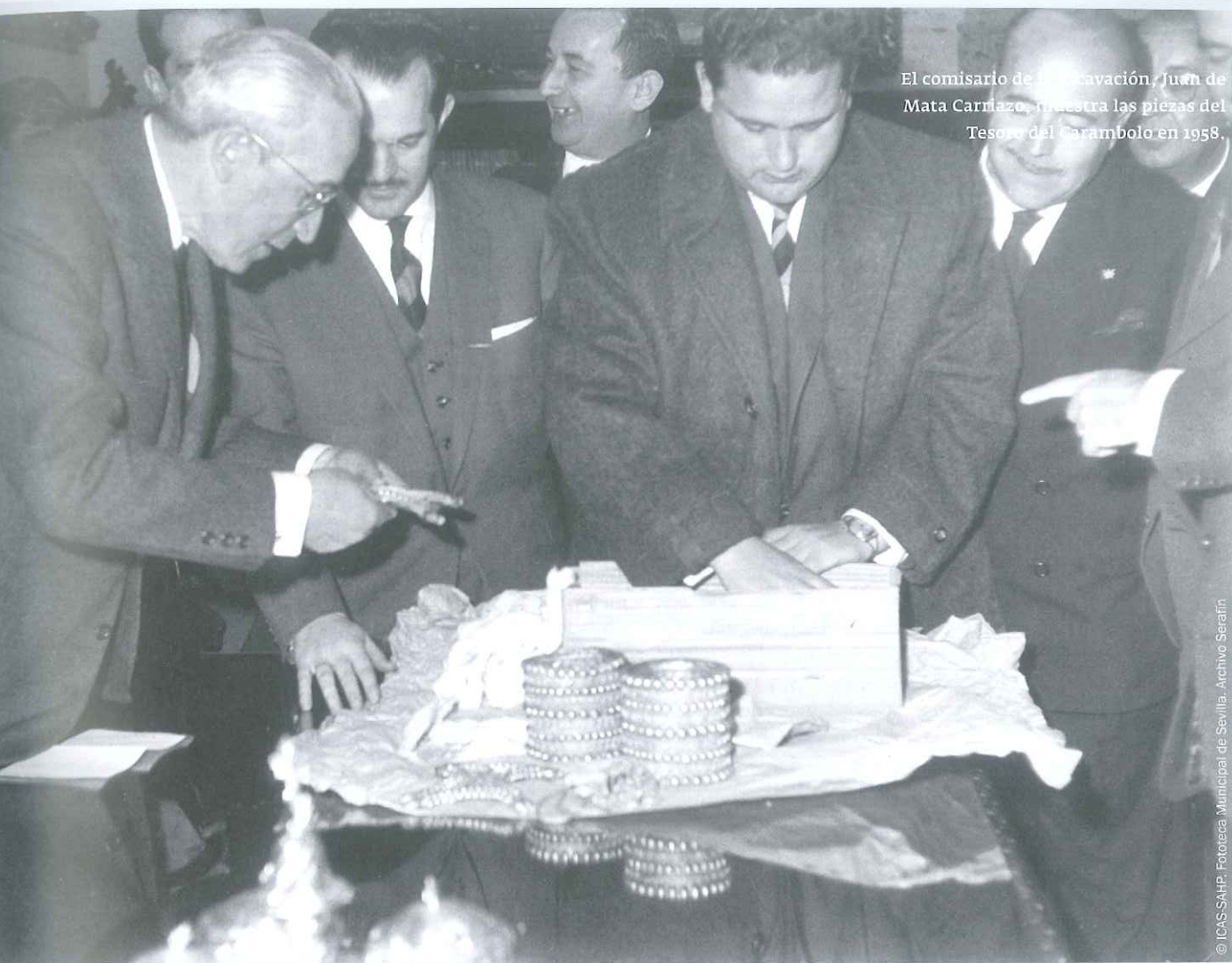
El comisario de la excavación, Juan de Mata Carriazo, muestra las piezas del Tesoro del Carambolo en 1958.