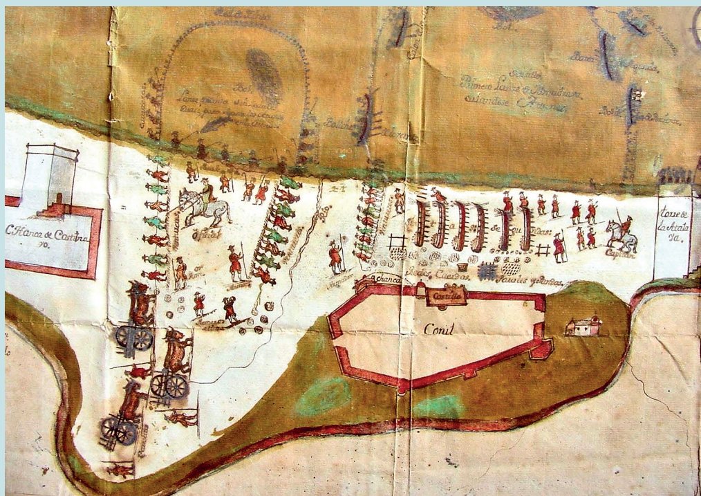
Plano de una almadraba de tiro en Conil en el siglo XVIII.