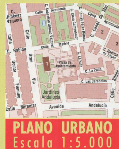
PLANO URBANO Escala 1:5.000