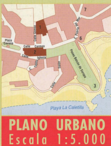
PLANO URBANO Escala 1:5.000