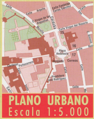
PLANO URBANO Escala 1:5.000