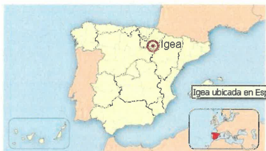
Ubicación de Igea en España.