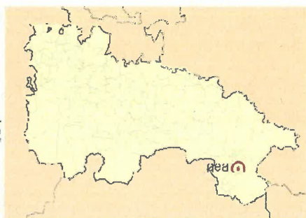
Ubicación de Igea en La Rioja.