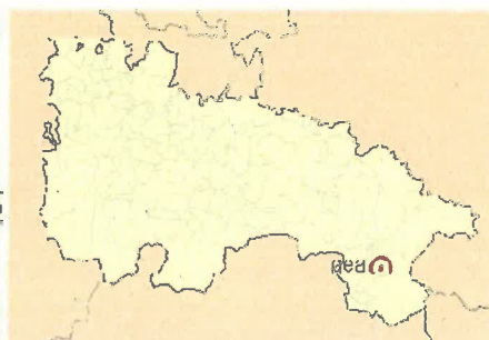
Ubicación de Igea en La Rioja.