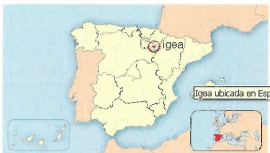
Ubicación de Igea en España.