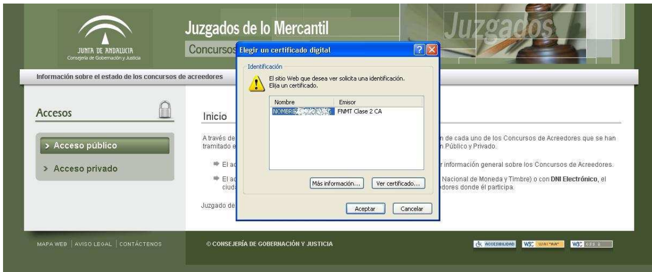
Fig. 1-7 Inicio privado

En el acceso privado se nos pide el certificado que vamos a usar.