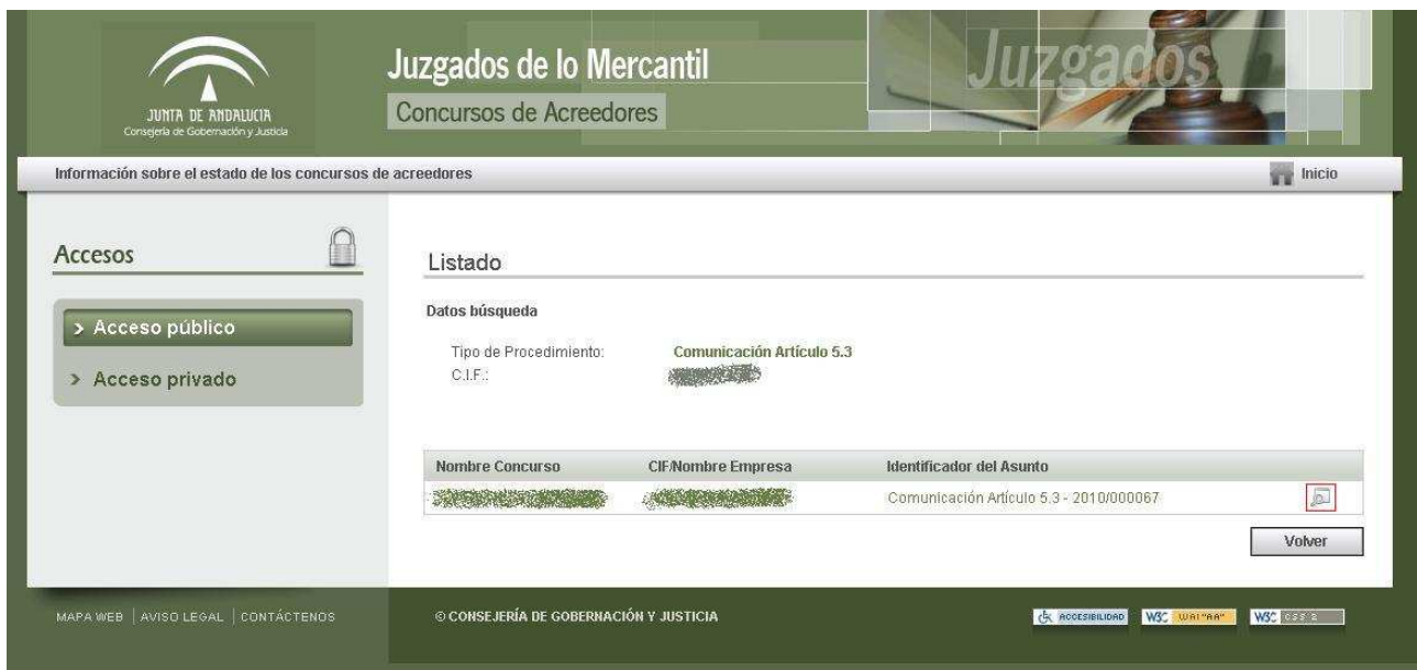
Fig. 1-4 Acceso al detalle de un concurso

Al pinchar sobre el icono derecho, como muestra la imagen de Acceso al detalle de un concurso se puede acceder a información más detallada del concurso de acreedor elegido.