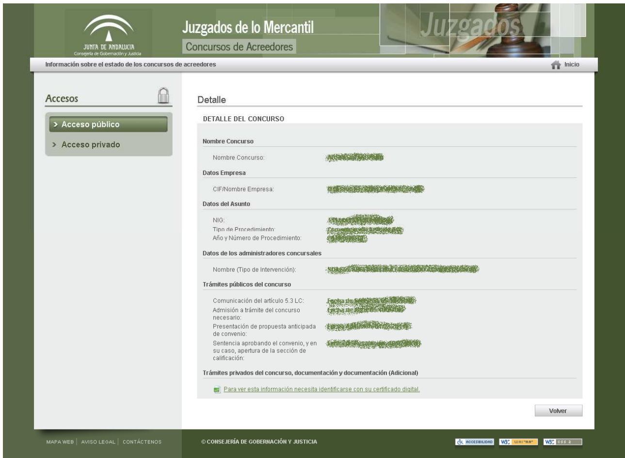
Fig. 1-5 Detalle de un concurso