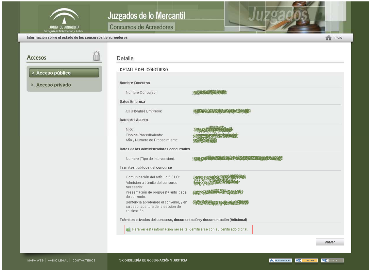
Fig. 1-6 ver documentación