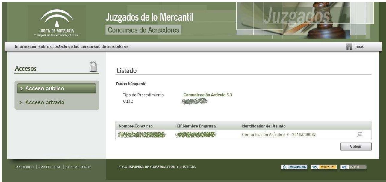
Fig. 1-3 Listado de concursos de forma anónima