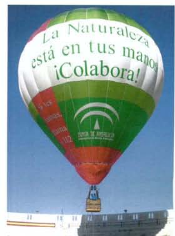
GLOBO AEROSTÁTICO, PARA LA PROMOCIÓN DE LA CAMPAÑA CONTRA INCENDIOS.

La Consejería de Medio Ambiente informa periódicamente al Consejo sobre distintos aspectos de la aplicación y desarrollo del Plan INFOCA.