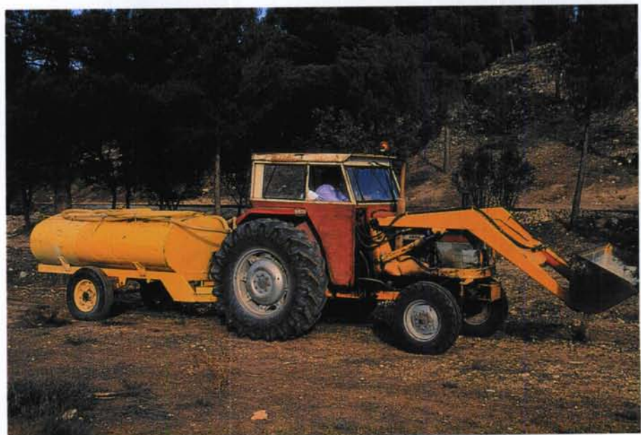
ENTRE LAS FUNCIONES DE LAS AGRUPACIONES DE DEFENSA FORESTAL ESTÁ LA DE APORTAR MEDIOS PARA LA EXTINCIÓN DE LOS INCENDIOS.

En la Consejería de Medio Ambiente existe un registro especial, de carácter administrativo, en el que se han de inscribir las ADF.