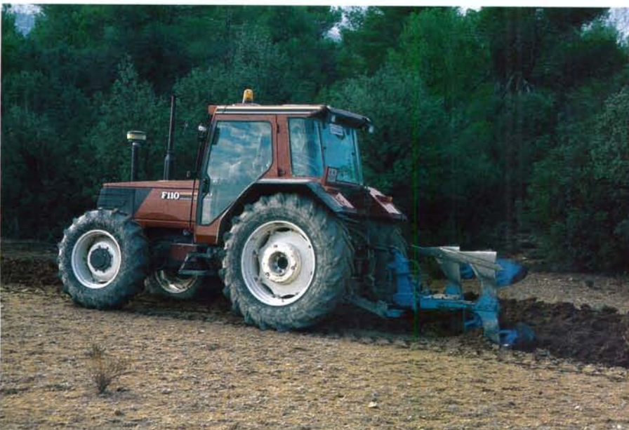
LAS TAREAS DE PREVENCIÓN A REALIZAR POR LAS AGRUPACIONES DE DEFENSA FORESTAL (ADF) PUEDEN SER FUNDAMENTALES PARA LA PROTECCIÓN DE LOS BOSQUES ANDALUCES.

La Consejería de Medio Ambiente podrá conceder beneficios a las ADFs a través de convenios de colaboración.