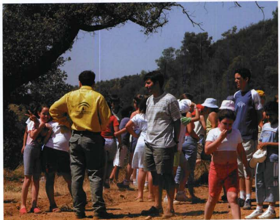
LAS CAMPAÑAS INFORMATIVAS QUE SE REALIZAN ENTRE LOS JÓVENES SON MUY IMPORTANTES PARA LA PREVENCIÓN DE INCENDIOS FORESTALES.

En aplicación de estos preceptos, la Consejería de Medio Ambiente, a través del Plan INFOCA, ha establecido un conjunto de medidas encaminadas a promover la participación social. Las principales son el establecimiento de una serie de mecanismos para canalizar esta participación, así como la realización de campañas de difusión y divulgación centradas en dar a conocer tales mecanismos y concienciar a la sociedad del papel esencial que los montes andaluces desempeñan en el mantenimiento de los equilibrios biológicos y como fuente de recursos renovables y por tanto la importancia de su conservación mediante una gestión sostenible que incluya la defensa frente al fuego.