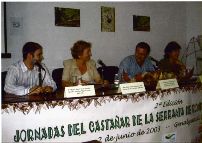
Ponentes de la 2ª mesa redonda