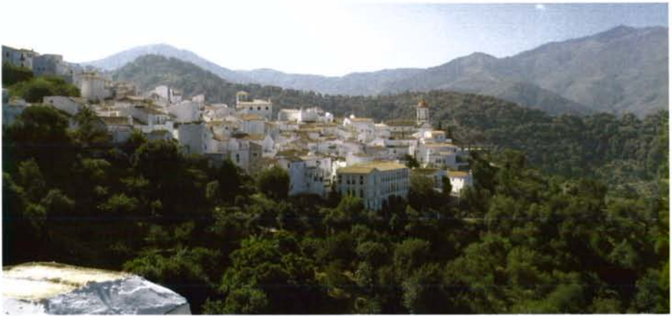
Vista general de Genalguacil

"Buenos días, comunicar que la señora Consejera de Medio Ambiente estará con nosotros por la tarde, ya que le ha surgido un problema y tiene el tiempo justo por lo que prefiere estar por la tarde para estar el mayor tiempo posible. Perdonad por el retraso de la inauguración pero las obras de las carreteras no las teníamos en cuenta y han hecho que algunas personas lleguemos tarde, pero de todas formas, bien merece venir a una zona tan hermosa como la vuestra. La verdad es que es una delicia poder ver este paisaje y contemplar estos maravillosos pueblos.