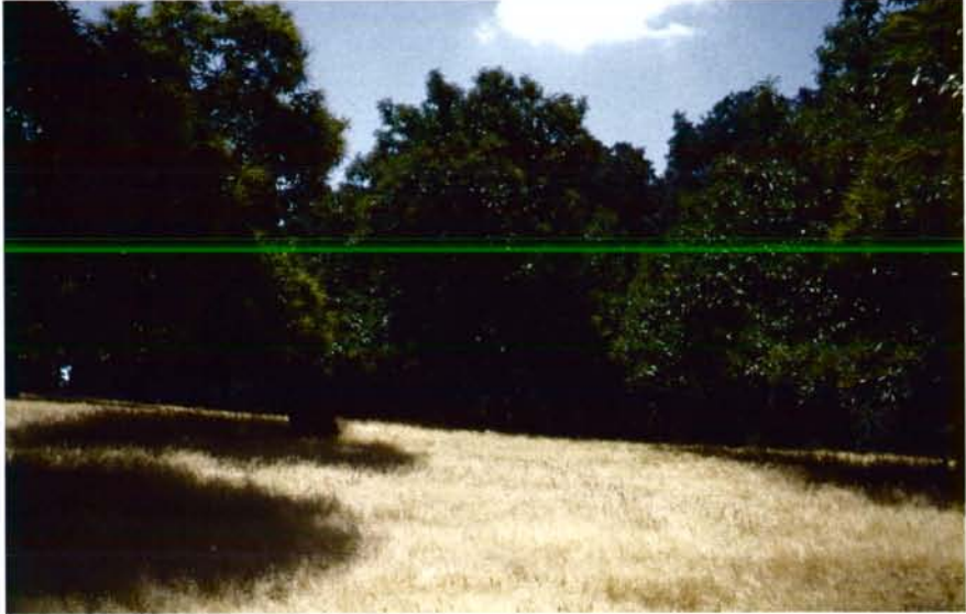
Castañar de la Sierra de Aracena

Ya nadie discute que el castaño cumple un papel fundamental dentro del Parque Natural Sierra de Aracena y Picos de Aroche y de la Sierra de Ronda y Sierra de las Nieves. El castaño cumple una triple función: desarrolla un papel socioeconómico; cumple a la vez una función protectora del ecosistema y por último, tiene también una labor paisajística de indudable valor turístico. Estas tres funciones han puesto en el primer plano de la actualidad el S.O.S. enviado desde el sector castañero andaluz para tratar de salvar este cultivo.