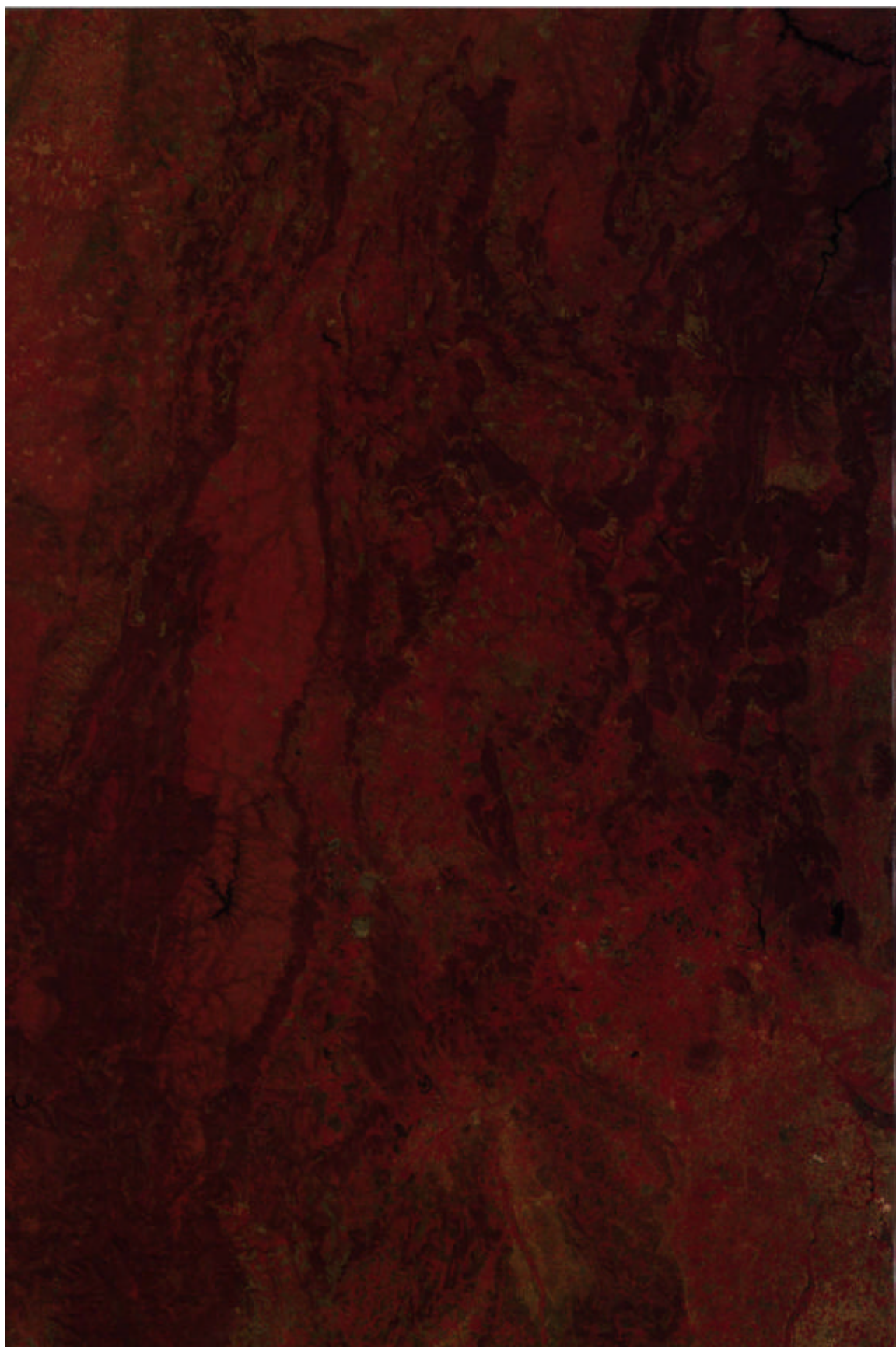
Imagen de satélite Landsat-MSS de fecha 7-05-87. Falso color infrarrojo.