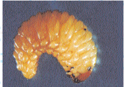
■ Larva con cuerpo fuertemente curvado