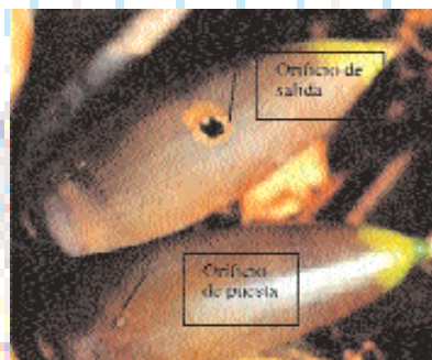
■ Orificios de puesta y de salida de la larva

Las larvas de estos carpófagos van deposi-