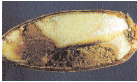
■ Excrementos de la larva

Los métodos de control recomendados actualmente son el control del adulto mediante insecticidas y el control de las larvas en la bellota. Este último control se lleva a cabo por el ganado, que consume las bellotas afectadas según se va produciendo la caída prematura de éstas. En este caso hay que tener en cuenta los posibles trastornos que se pueden producir en el ganado debido a la ingestión de gran cantidad de bellota inmadura. Esta activi-