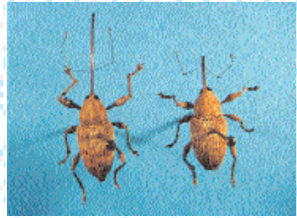
■ Macho y Hembra de Curculio elephas

Curculio elephas presenta un ciclo con una generación al año. Los adultos aparecen desde mediados de agosto a finales de septiembre (SORIA & VILLAGRÁN, 2000). Otros estudios realizados en Extremadura (BONILLA & ARIAS, 2000) indican que la emergencia se produce a finales de verano y principio de otoño, claramente determinados por las lluvias en este periodo. Se alimentan durante una semana y una vez alcanzada la madurez sexual realizan la puesta, que consiste en la colocación de uno y, a veces, 2 ó 3 huevos en el interior de frutos de castaños y quercíneas, con una fecundidad media de 40 huevos/hem-