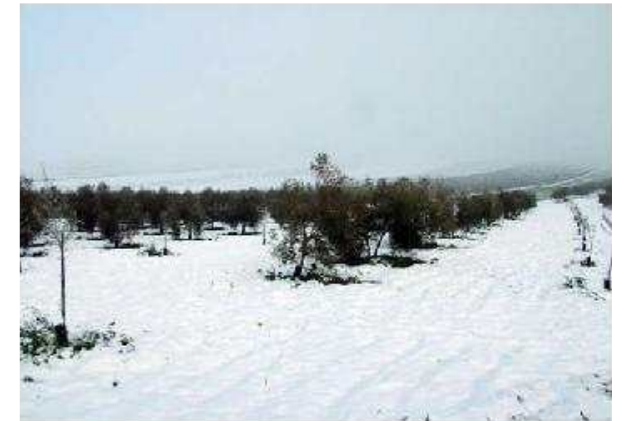
Olivares nevados en la Sierra Sur