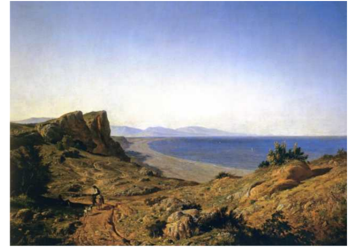
Un país. Recuerdos de Andalucía, costa mediterránea, junto a Torremolinos, 1860 Carlos De Haes.

Al cabo de cinco días deje Ronda para dirigirme hacia Marbelah o Marbella. El camino entre esas dos ciudades es muy escabroso, muy difícil, lleno de obstáculos. Marbella es una ciudad pequeña, en donde los alimentos abundan. Allí encontré un grupo de caballeros que salían para Málaga.