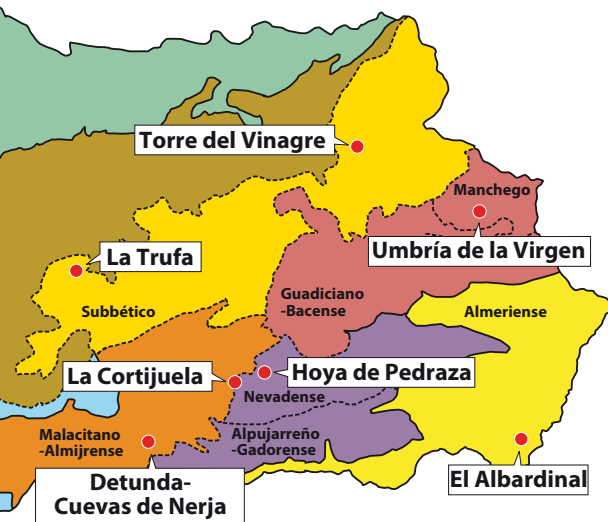
Distribución de los Jardines Botánicos de la Red Sectores Biogeográficos

La Red Andaluza de Jardines Botánicos en Espacios Naturales apuesta decididamente por el desarrollo y aplicación eficaz de la Estrategia Mundial para la Conservación de la Naturaleza y el Convenio sobre Diversidad Biológica. Como centros de conservación, recuperación y reintroducción de especies silvestres, la Red participa en la estrategia de conservación de esta Consejería y coordina sus actuaciones con otros organismos e instituciones regionales, nacionales e internacionales como la International Association of Botanic Gardens (IABG) o la Asociación Iberomacaronésica de Jardines Botánicos (AIMJB).