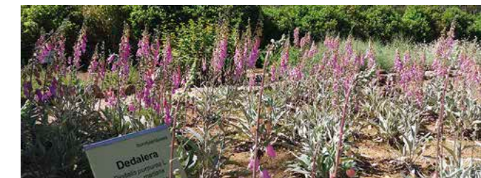
Dedalera de Sierra Morena

Zona dedicada a la conservación y a la reproducción de las especies exclusivas del sector y de aquellas que se encuentran amenazadas por diversas causas. Destacamos el brezo del Andévalo, la centaurea de Despeñaperros y dedaleras endémicas de Sierra Morena.