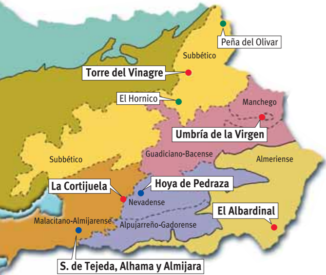
Distribución de los Jardines Botánicos de la Red Sectores Biogeográficos

La Red Andaluza de Jardines Botánicos en Espacios Naturales apuesta decididamente por el desarrollo y aplicación eficaz de la Estrategia Mundial para la Conservación de la Naturaleza y el Convenio sobre Diversidad Biológica. Como centros de conservación, recuperación y reintroducción de especies silvestres, la Red participa en la estrategia de conservación de esta Consejería y coordina sus actuaciones con otros organismos e instituciones regionales, nacionales e internacionales como la International Association of Botanic Gardens (IABG) o la Asociación Iberomacaronésica de Jardines Botánicos (AIMJB).