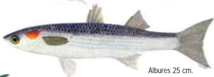
Albures 25 cm.