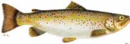
Trucha común Solo captura y suelta