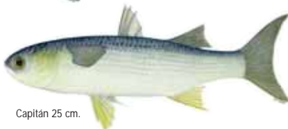
Capitán 25 cm.