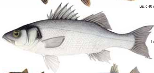
Lubina 36 cm.