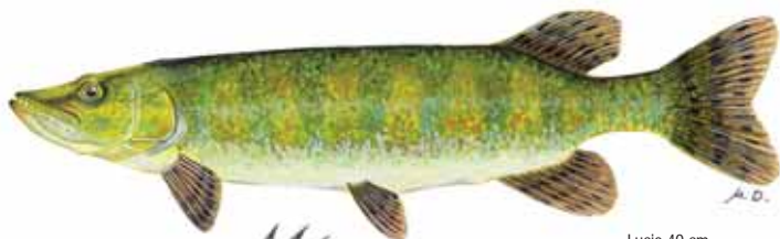
Lucio 40 cm.