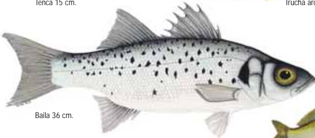
Baila 36 cm.