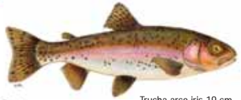
Trucha arco iris 19 cm.