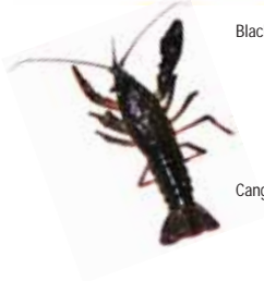
Cangrejo rojo, sin limitación