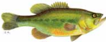
Black Bass 21 cm.