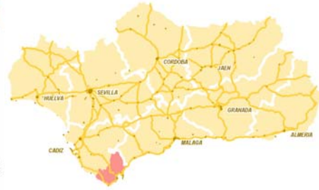
ÁMBITO DEL PLAN