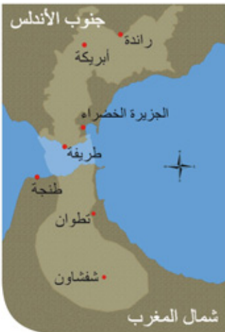
المجال المقترح لمحمية المحيط الحيوي للربط القاري المتوسطي