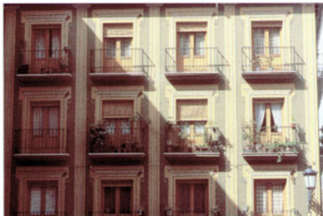
Campaña: ¡Pon una maceta en tu ventana!