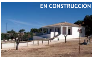
Ctra. Zuheros-Cueva de los Murciélagos. A 3,8 km de Zuheros Teléfono: 957 001 300

Buscando la respuesta a un enigma que se nos plantea al inicio de la sala de exposición del centro, recorreremos diferentes salas que simulan el entorno de la cueva. A través de la exposición conoceremos cómo se originó la Cueva de los Murciélagos, así como la historia de sus habitantes.