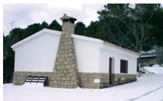
Ctra. Cruce del Valle- Puente de las Herrerías km 7 Vadillo Castril, Jaén Teléfono: 953 124 235