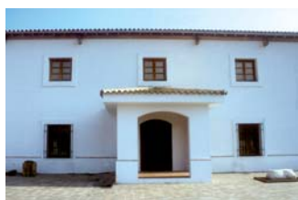
Camino Rural Almadén de la Plata- Los Melonares km 5,5 Almadén de la Plata, Sevilla Teléfono: 955 952 049