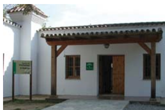
Ctra. Constantina-Pedroso km 1 Constantina, Sevilla Teléfono: 955 881 597