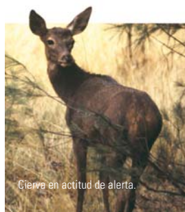
Ciervo en actitud de alerta.

La actividad cinegética implica la exigencia de una planificación y gestión correctas