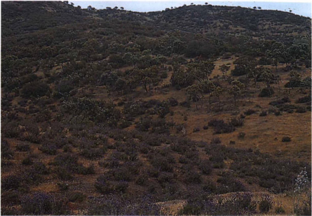
13. Cantuesal ( Scillo maritimae - Lavanduletum pedunculatae ) (Foto R. Pinilla).