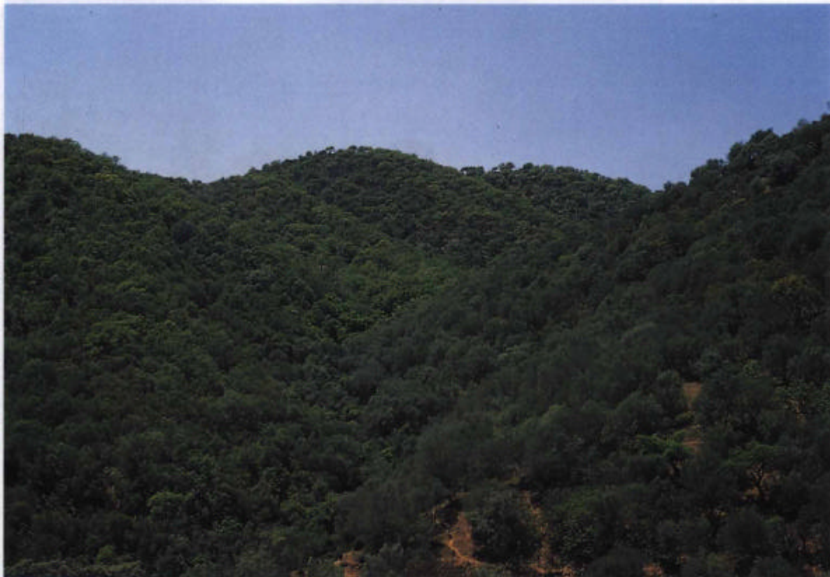
16. Encinares silicícolas mesomediterráneos ( Pyro bourgaeanae-Quercetum rotundifoliae myrtilosum commune ) + Madroñales ( Ericion arboreae ) (Foto R. Pinilla).