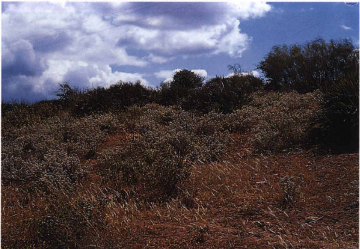
14. Tomillar ( Micromerio micranthae - Coridothymion capitati ). En primer plano pastizal subnitrófilo de la asociación Aegilopeto neglectae - Stipetum capensis.