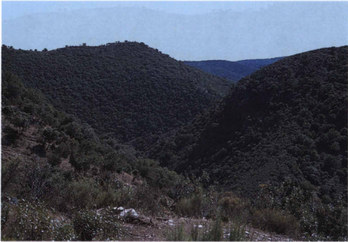
15. Encinares silicícolas mesomediterráneos ( Pyro bourgaeanae-Quercetum rotundifoliae myrtilosum commune ).