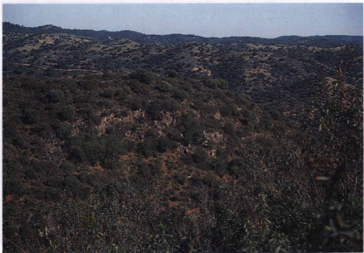
18. Acebuchales ( Asparago albi-Rhamnetum oleoidis cocciferetosum ), sobre calizas duras.