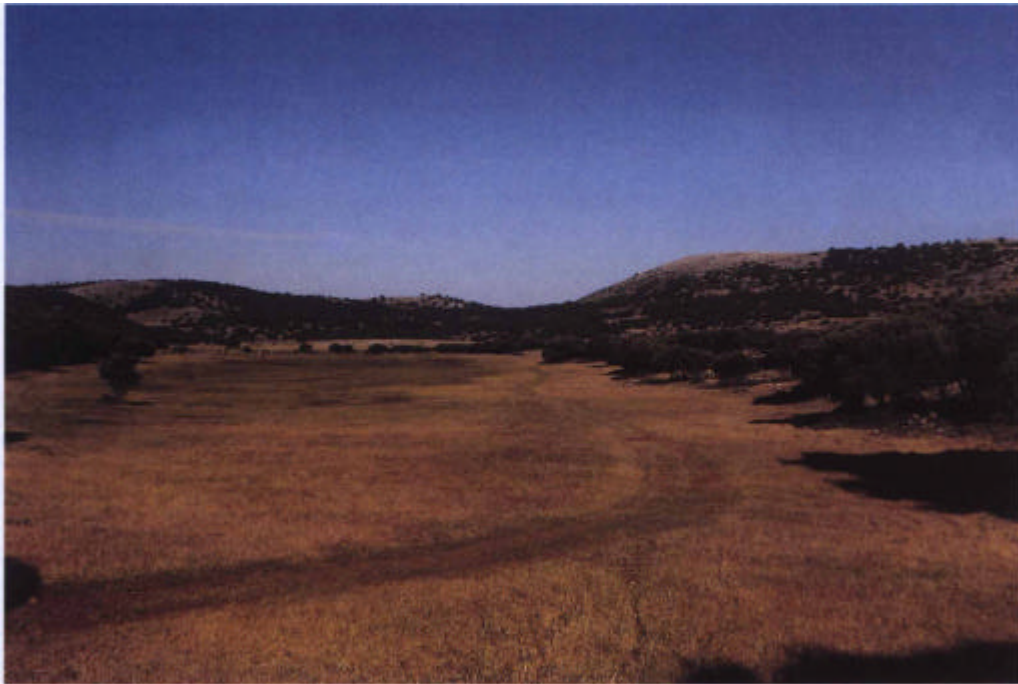
10. El poljè de La Nava (zona septentrional).