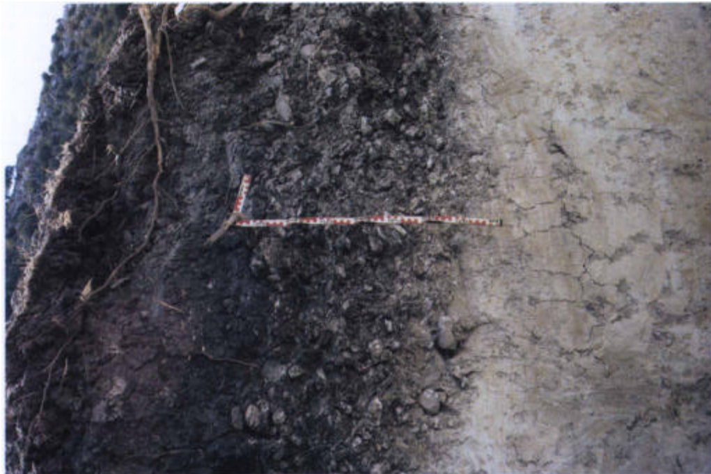
12. Perfil CO-240: Vertisol eútrico sobre gravas y materiales margosos.