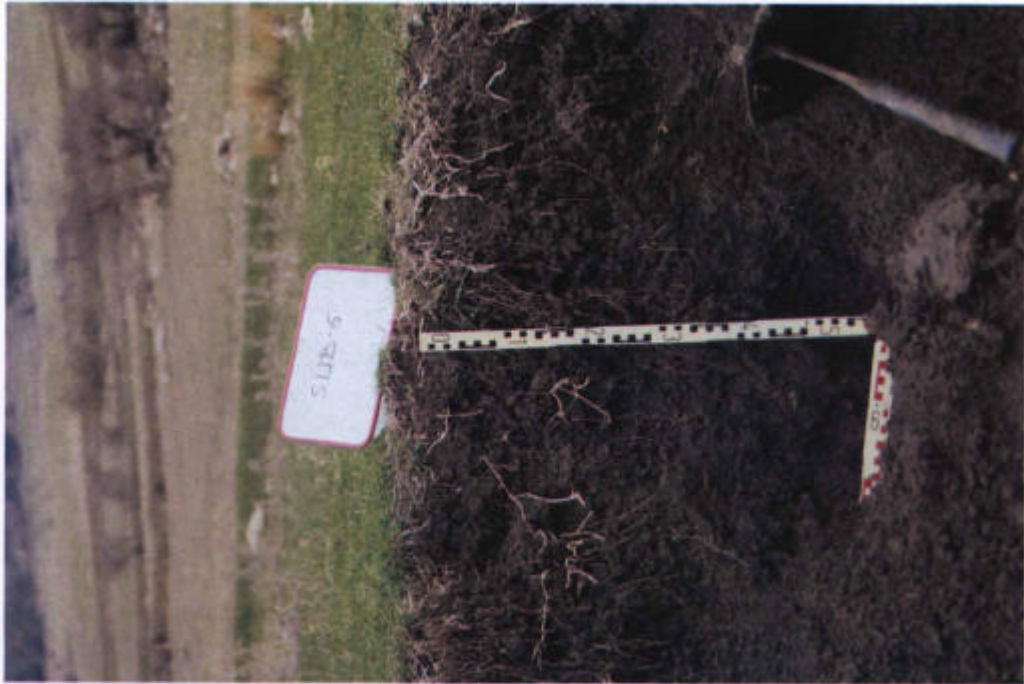
14. Fondos de la depresión del Navazuelo, Vertisol eútrico (CO-243).