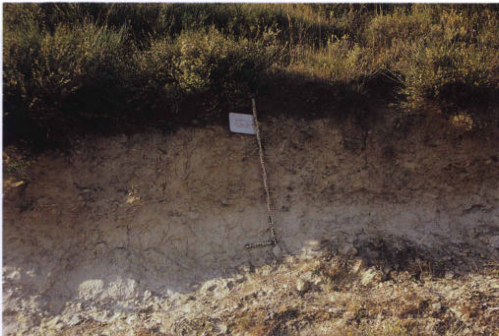
18. Perfil CO-253, Leptosol rendzínico sobre margas cretáceas solifluxionadas en la vertiente septentrional de la Sª de Jarca.