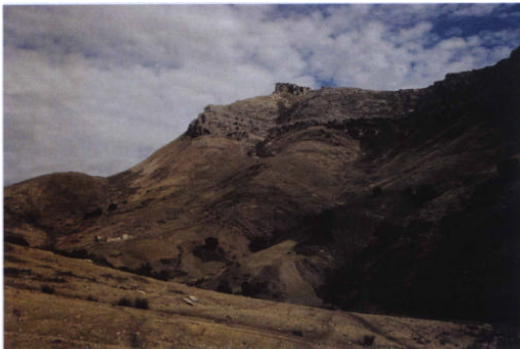
16. La Sierra Horconera y Puerto Mahina.