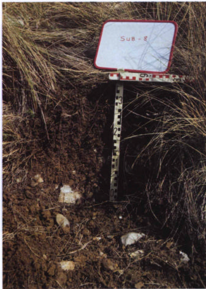
15. Perfil CO-245, Leptosol dístico en 5ª Horconera.