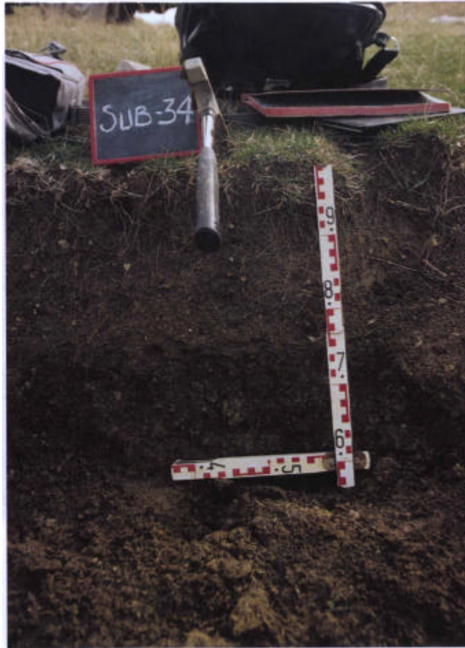
17. Leptosol distrito perfil CO-269 sobre radiolaritas del Puerto Mahina.