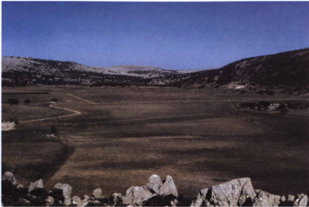
9. El poljè de La Nava (zona meridional).