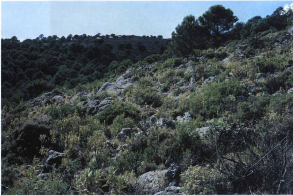
13. Romeral con matagallos y aulagas en la Sierra de Rute. https://doi.org/10.26434/chemrxiv-2023-33333