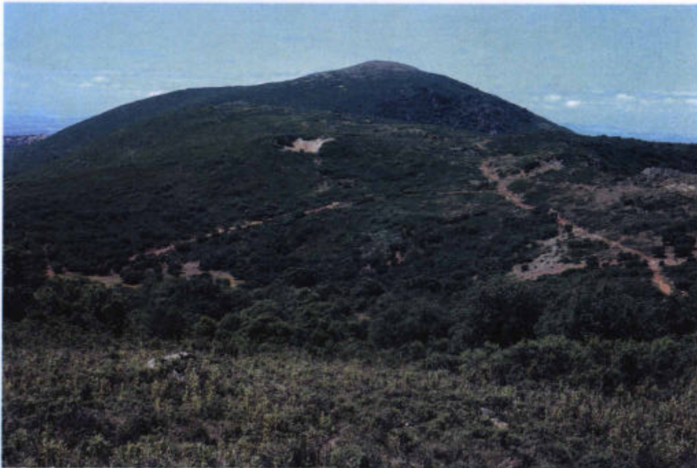
12. Encinares y coscojares en la Camorra.