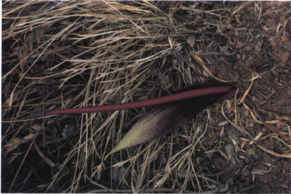
19. Biarum carratricense.