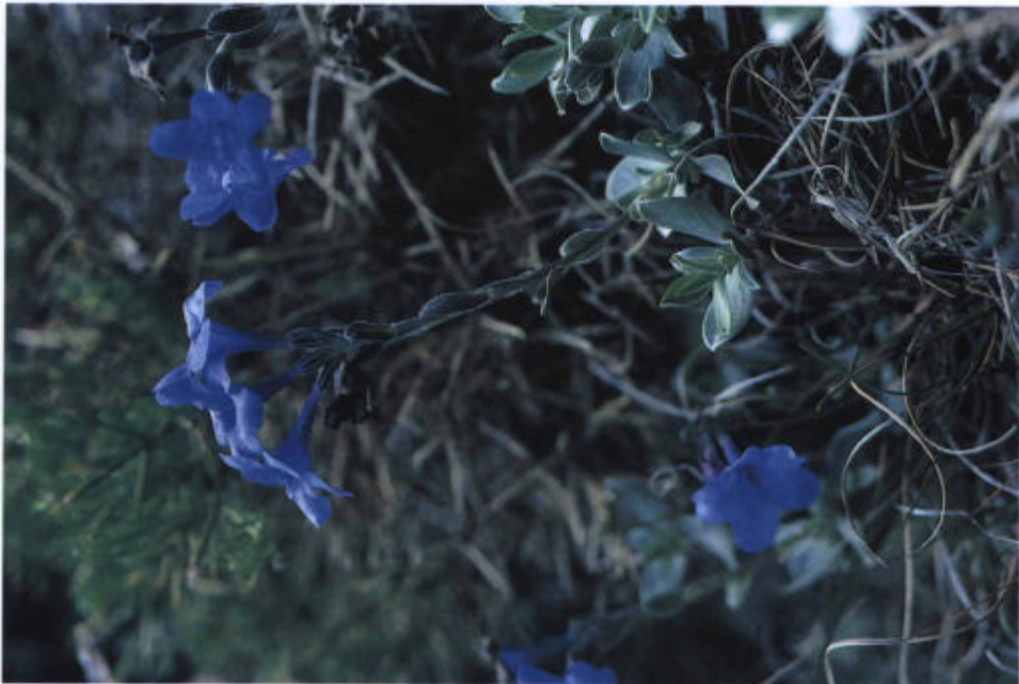
20. Lithodora nitida , interesante endemismo subbético que se consideraba endémico de Sierra Mágina y hemos localizado en el Parque.