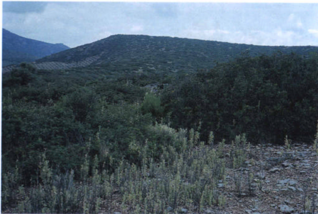
14. Lentiscar de Morrón Grande. https://doi.org/10.26434/chemrxiv-2023-33333