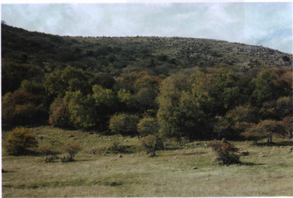
15. Acerales y espinares de la Nava.