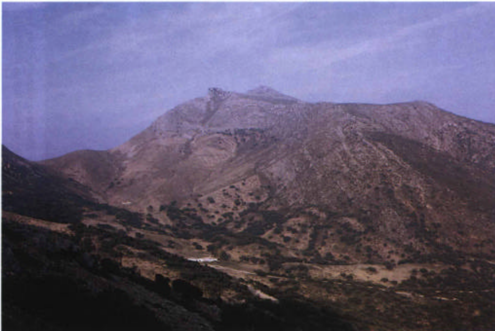
18. Sierra Horconera y La Tiñosa, techo del Parque.