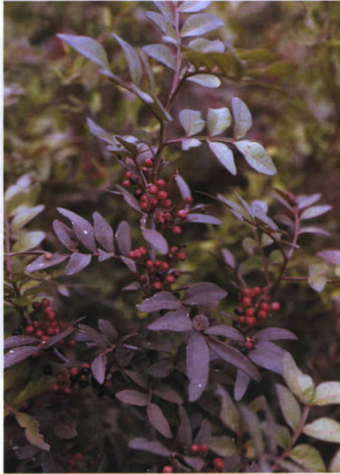
17. Lentisco ( Pistacia lentiscus ).