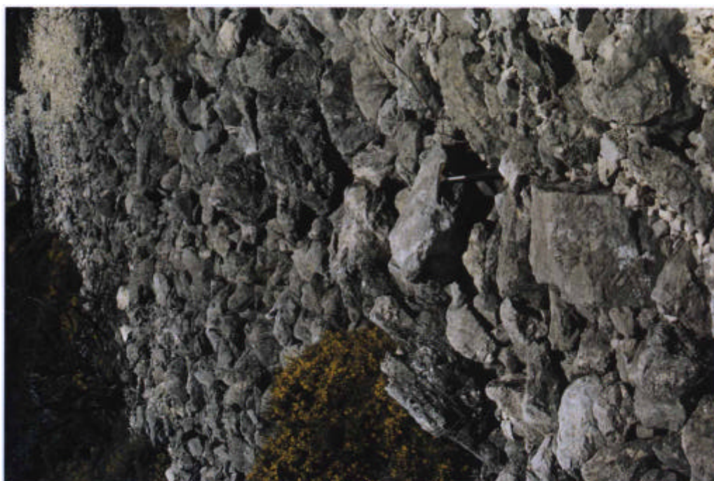
50. Canchales actuales en la S a de Rute.