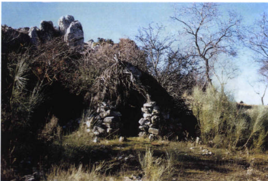
54. Antiguas chozas de pastores.