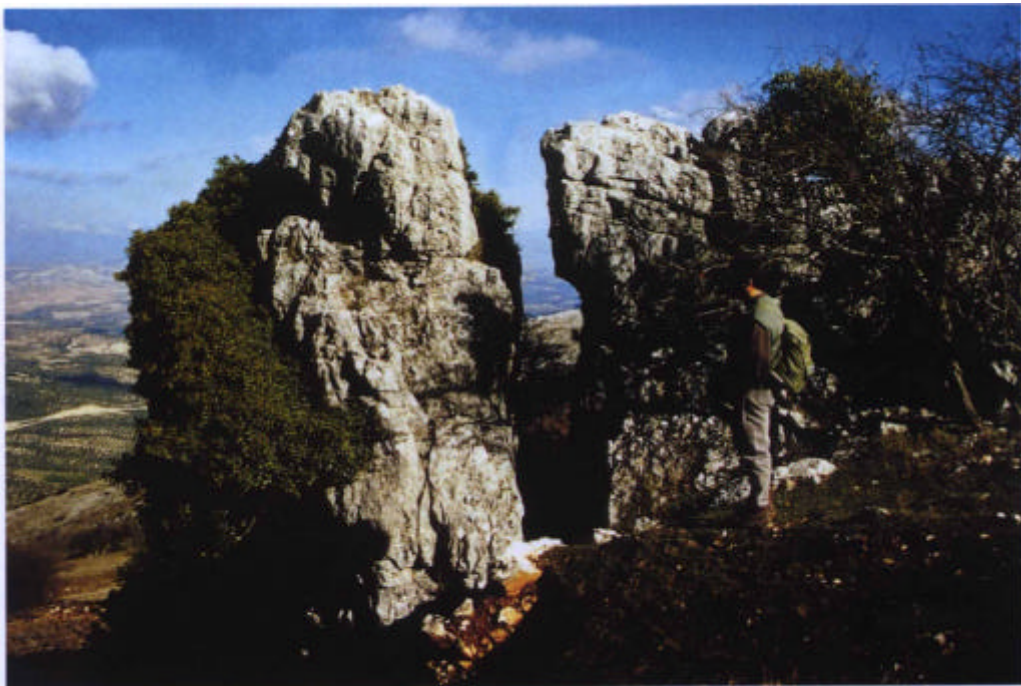
56. Escarpes y desprendimientos recientes.