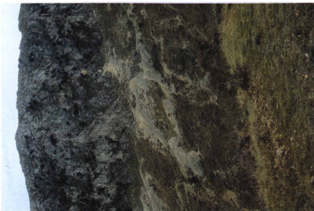
49. Escarpes y áreas de canchales en la S a Horconera.