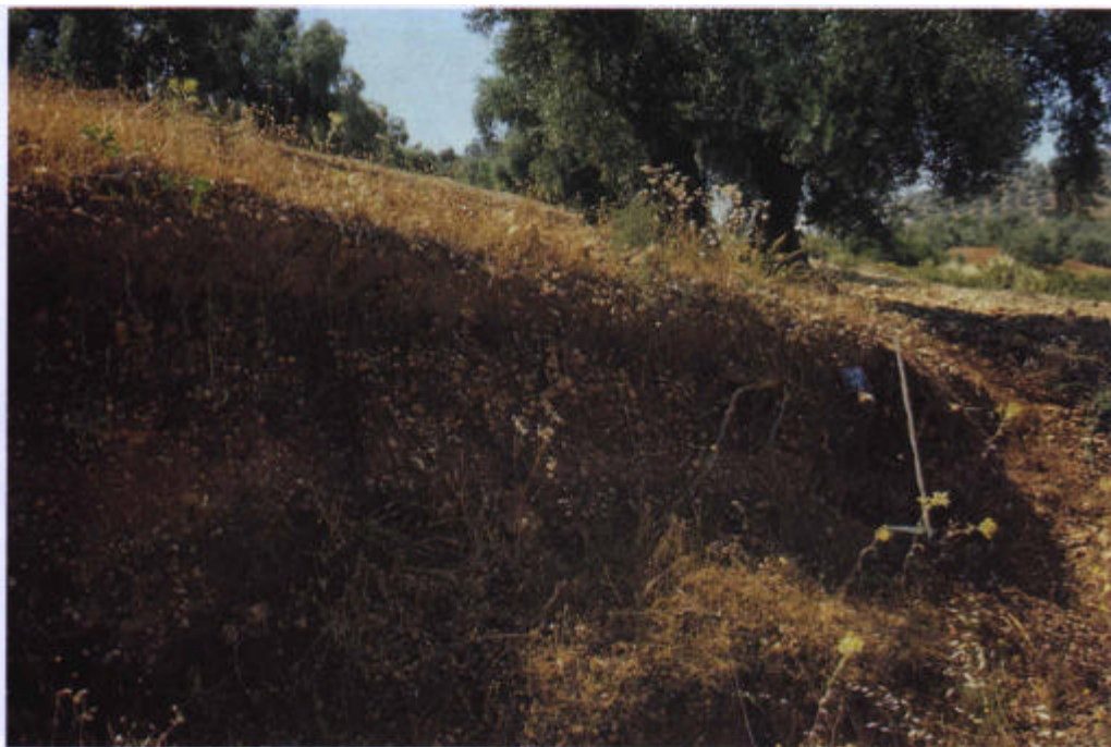
52. Perfil CO-256, Regosol eútrico sobre grèzes-litées del cerro de La Camora.