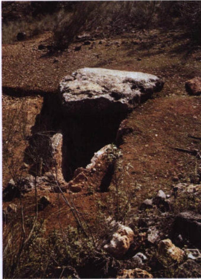
55. Megalito en las cercanías de la Nava de Luque.