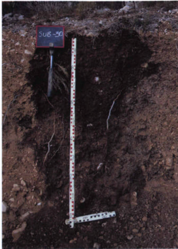
53. Detalle del perfil CO-267.