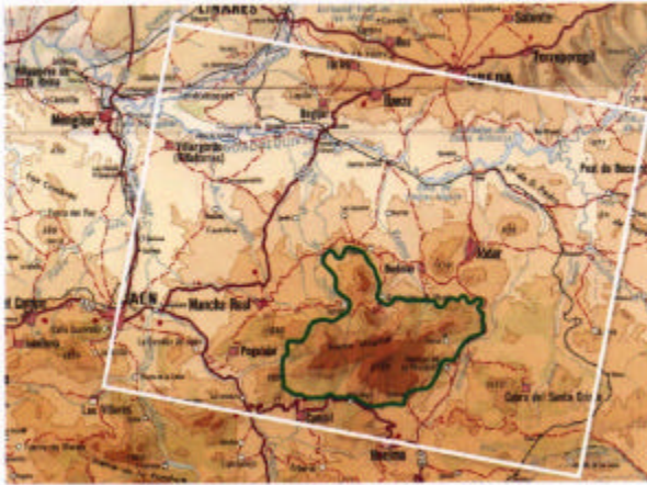
Mapa serie World. E 1/500000. Instituto Geográfico Nacional. Límites del Parque Natural y área de visualización de la imagen de satélite.